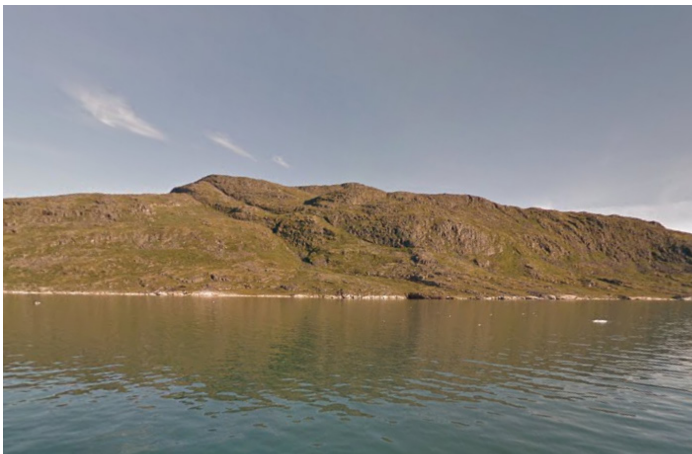
Qeqertaq / Øen Qingaarsuup Nunaa / Tullerunnat Killiit